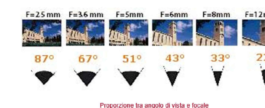
Proiezione tra angolo di vista e focale

La focale e la dimensione della diagonale del sensore, influenzano l'angolo di vista. A parità di sensore si avrà una distanza focale maggiore che determinerà un angolo di vista minore. Una diagonale del sensore minore, produrrà un angolo di vista minore, mentre una diagonale maggiore produrrà un angolo maggiore. In commercio sono disponibili gli obiettivi VARIFOCAL, in grado di assumere focali diverse attraverso la ghiera di regolazione.